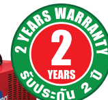
WELTIG 315P AC-DC (WATER COOL)

POST GAS HF Start SLOP DOWN 2T/4T TIG MMA HEAVY DUTY PULSE